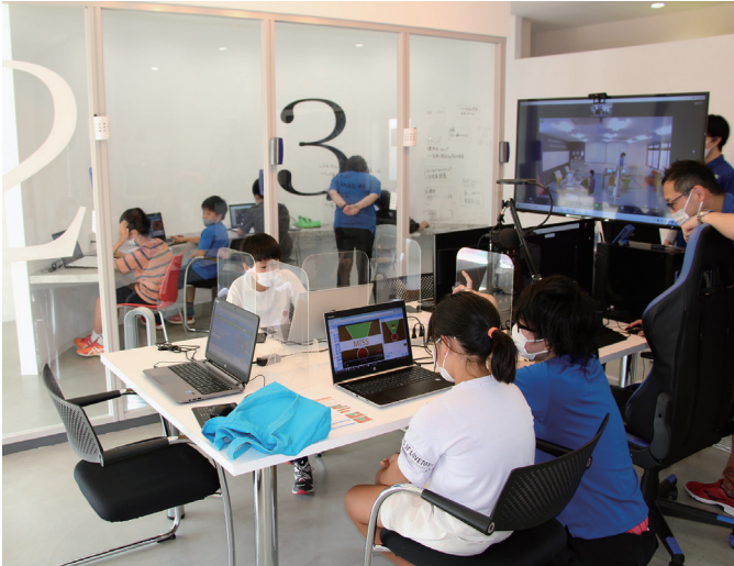
オープンした新潟西校の様子

新潟市中央区と西区に2校のプログラミング教室を運営している株式会社ヒューマンリソースのミライのプログラミング__ミラプロがミラプロ新潟西校として西区小針に移転オープンしました。子どもたちのプロ意識が高まるようなITオフィスのようなデザインに教室のイメージを切り替え、プログラミングの学びが子どもたちの将来の仕事に繋がることを意識できるような先進的なデザインにしました。