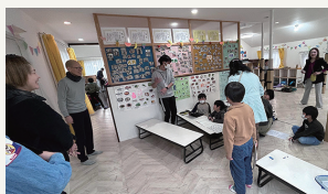
明るくオープン＆ 雰囲気のある 学童施設