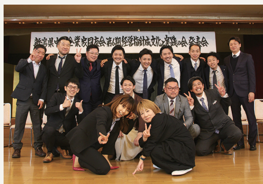
前期受講生は サポーター1年目で大活躍!!