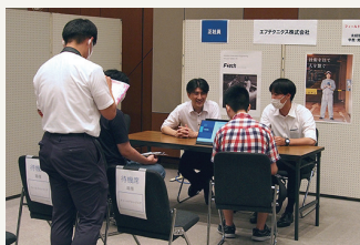
8/2 やさしい 仕事説明会