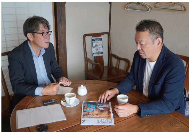
米山委員(左)と山田さん(右)