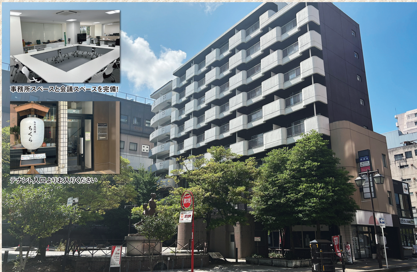
事務所スペースと会議スペースを完備!