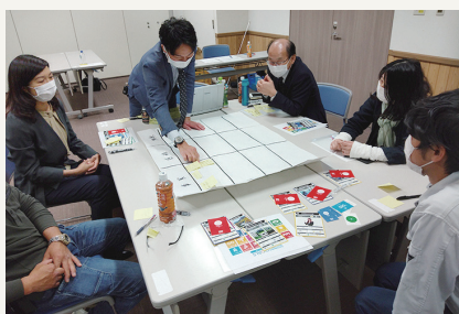
中小企業活性化プラン