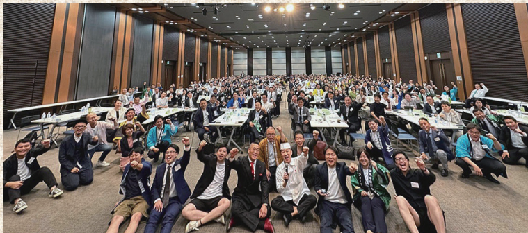
青年経営者フォーラムの様子