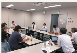
経営指針成文化と実践の会の様子