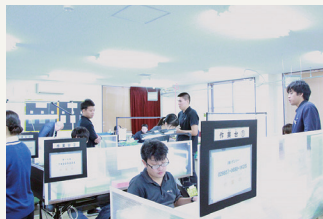
セミナーや企業見学の様子