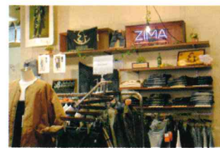
実店舗だけでなく楽天市場などインターネット販売も行っている

私は助けられながら今まで来ました。10年以上働くスタッフもいてくれて、みんなが自分たちで考えて動いてくれたから、ここまで来られたんだとつくづく思います。共に学びながら、スタッフと家族に幸せを感じさせたいという想いが、今の全てです。