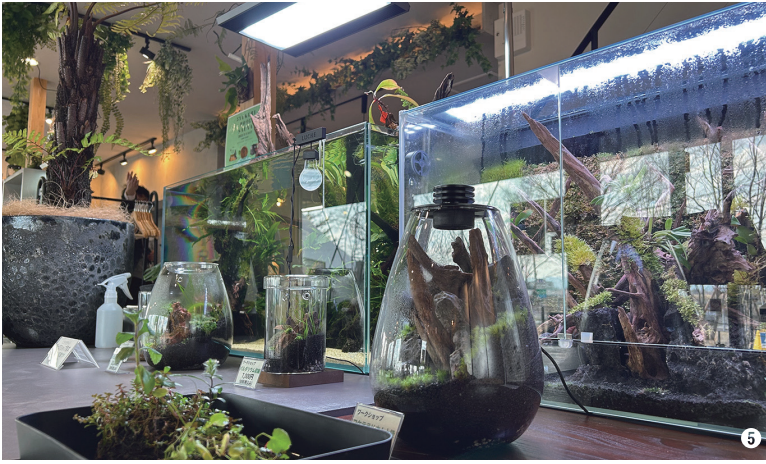
①② モデルスペース ③④⑤ カフェスペース

していただけるようなスペースにしました。施工に関するご相談で来店いただく際は、パーティションの個室スペースにご案内し、カフェスペースと隣接させることで、より特別な空間での打ち合わせを体感できるようになっています。 モデルスペースは、住宅用のプールやサウナ・キャンプ Tent 等、弊社で用意できる「夢のガーデンライフ」をイメージしました。これは、予約制で貸し出しも行っており、カフェスペースとはパーティションで区切ることで、非日常的魅力を体感できる空間になっています。 駐車場をスロープ式にしたことで、車いす